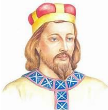
➤ Sv. Václav